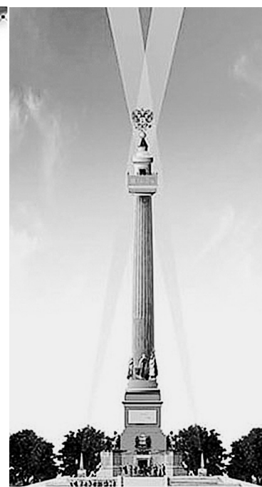
Высота 33 м, бронза, гранит, стоимость 30 млн. рублей

В администрации района состоялось заседание комиссии по выбору проекта памятной стелы «Город трудовой доблести».