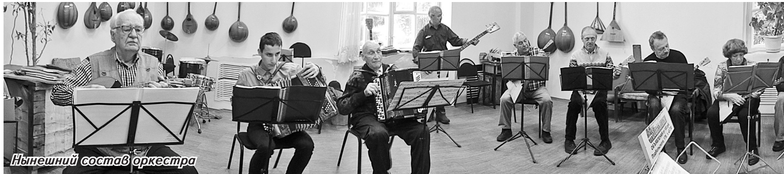
Нынешний состав оркестра

В период проведения публичных слушаний с материалами, подлежащими рассмотрению на публичных слушаниях, можно ознакомиться на официальном сайте Администрации Боровичского муниципального района www.borovitn.ru в разделе «Архитектура и градостроительство» — публичные слушания или в рабочие дни с 14.00 до 17.00 в отделе архитектуры и градостроительства Администрации Боровичского района по адресу: Новгородская обл., г. Боровичи, ул. Коммунарная, д. 48, кабинеты №№ 11-13.